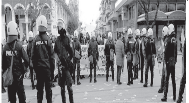
Φώτο από τη συγκέντρωση στα Ιωάννινα ενάντια στην εκδήλωση ενάντια στις αμβλώσεις στις 22/02/2020 η οποία πραγματοποιήθηκε υπό την αιγίδα της Μητρόπολης.

Ο αγώνας μας λοιπόν ενάντια στην πατριαρχία, δεν μπορεί να μην είναι και αγώνας ενάντια σε κράτος και κεφάλαιο. Αν δεν αντιληφθούμε το σύμπλεγμα των εξουσιών ως τέτοιο, οι αγώνες μας πάντα θα αφομοιώνονται. Πάνω στο ζήτημα του όρου γυναικοκτονία, η ουσία δεν είναι να διεκδικήσουμε να κατοχυρωθεί νομικά αλλά να την ενστερνιστεί η κοινωνία ως τέτοια, καθώς έχει έμφυλα κίνητρα. Όσες φορές και να ακούσουμε τον όρο από τα κανάλια και τους πολιτικούς, δεν τους έχουμε καμιά εμπιστοσύνη. Χαρακτηριστική είναι