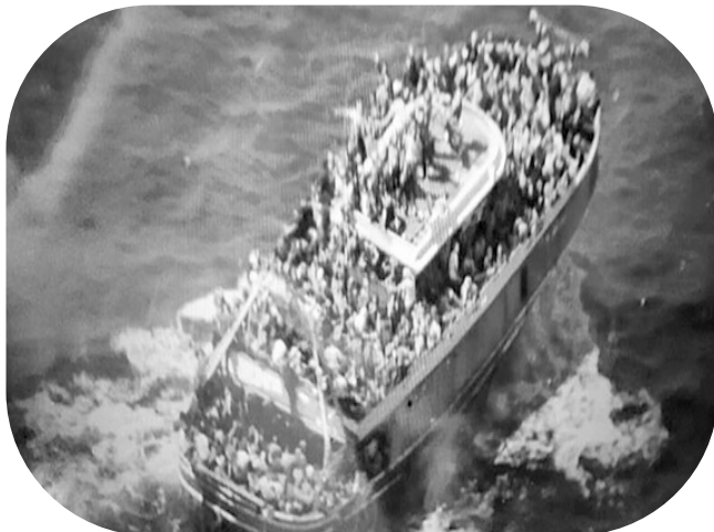
Φωτογραφία του πλοίου λίγο πριν βυθιστεί κοντά στην Πύλο.

Λίγους μήνες πριν, ένα ναυάγιο πλοιαρίου γεμάτο με μετανάστες κοντά στην Πύλο ήρθε για να "συνταράξει" την κυβέρνηση, τα ΜΜΕ καθώς και κομμάτια της κοινωνίας. Φυσικά τόσο πριν, όσο και μετά από αυτό, έχουν ακολουθήσει και άλλα παρόμοια, τα οποία όμως έγιναν πολύ λιγότερο γνωστά από τα ΜΜΕ. Όπως έχουμε αναφέρει και στο παρελθόν, δε μπορούμε να πούμε πως εκπλαγήκαμε όταν αντίθετα με τους ισχυρισμούς του λιμενικού αλλά και του ελληνικού κράτους, αποδείχθηκε η συμμετοχή του πρώτου στη βύθιση του σκάφους. Η αντιμετώπιση τέτοιων καταστάσεων και συνολικά των μεταναστών, από το ελληνικό αλλά και από όλα τα κράτη, ακολουθεί αιώνες τώρα την ίδια πεπατημένη. Όσο και να προσπάθησε -ας πούμε- η αντιπολίτευση να μας πείσει πως αν είχε τα νύια, τα πράγματα θα είχαν εκτυλιχτεί διαφορετικά, δεν ξεχνάμε πως και επί της δικής της τετραετίας πάλι τα ίδια συνέβαιναν (βλ. ναυάγιο στο Φαρμακονήσι το 2015).