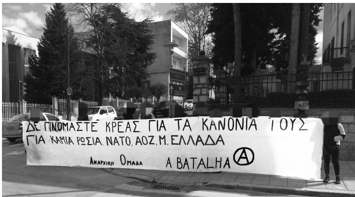
Αντιμιλιταριστική παρέμβαση της Α Βαταλθα έξω από τη Μερραρχία Ιωαννίνων στις 26/02/2022, με αφορμή τον πόλεμο στην Ουκρανία.

Καθώς τα γεγονότα εξελίσσονται προσπερνώντας αρκετά πρόσωπα και καταστάσεις, φτάνοντας στο πιο σύντομο παρελθόν οι αφηγήσεις θέλουν τον ηθοποιό Ζελένσκι να κερδίζει τις εκλογές το 2019. Ένας εντελώς “τυχαίος” άνθρωπος θα λέγαμε. Ένας άνθρωπος που βρέθηκε κατά λάθος σε μία συνθήκη παγκόσμιας πανδημίας και οικονομικής κρίσης να βρεθεί και εντελώς τυχαία σε μία εμπόλεμη κατάσταση(;) Ίσως μπορεί να είναι όντως τυχαίο να έχει καταφέρει μέχρι και σήμερα να είναι το ηγετικό στέλεχος των αποφάσεων στο ένα από τα δύο βασικά στρατόπεδα, στο πιο καυτό καζάνι που βράζει. Ίσως να φταίει η καχυποψία κάποιων “επιτήδειων” που απλά θέλουν να ρίξουν στάχτη στα μάτια των υπολοίπων για να μη μάθουν όλη την αλήθεια και οι τυχαίες ναζιστικές του παρέες όπως το Τάγμα Αζόφ (βλ. βουλή των Ελλήνων) απλά μπορεί να ήθελαν την παγκόσμια ελευθερία και ειρήνη. Δεν είμαστε όμως αρκετά εύπιστοι για να πιστέψουμε κάτι από τα παραπάνω.