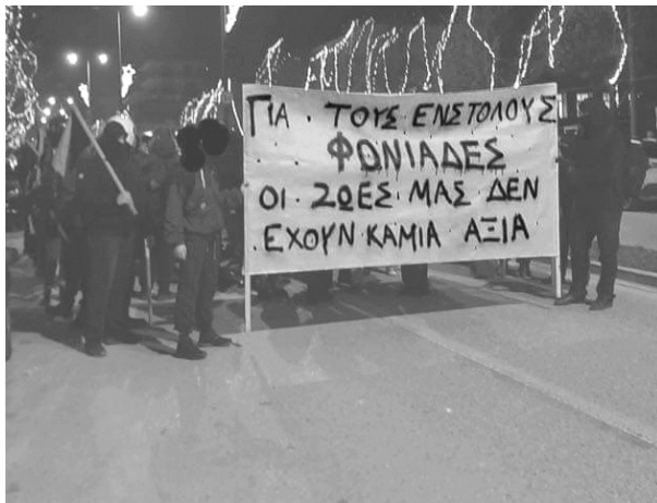
Στιγμιότυπο από την πορεία στα Γιάννενα στις 06/12/2022.

Όλοι οι παραπάνω δεν αποτελούν ένα αυτόνομο κομμάτι της χώρας: υπάρχουν και δρουν με την εννοχρήστρωση και τις πλάτες του κρατικού μηχανισμού. Άλλωστε τα κράτη πάντοτε ήταν ο εφαρμοστής της κάθε ρατσιστικής και φασιστικής πρακτικής που απαιτούσαν είτε το κεφάλαιο, είτε οι ακροδεξιοί νοικοκυραίοι. Από τα καθόλα νόμιμα πογκρόμ σε μετανάστες (επιχείριση Ξένιος Ζευς), στη διαπόμπευση των οροθετικών γυναικών, τις ειδικές συνθήκες σύγχρονης δουλείας σε περιοχές όπως η Μανωλάδα μέχρι τα στρατόπεδα συγκέντρωσης όπως στην Μόρια, οι κυβερνήσεις καταπιέζουν, διαιρούν και υποτιμούν τους καταπιεσμένους αυτού του κόσμου. Και φυσικά και δεν μιλάμε για ακροδεξιές ή φασιστικές κυβερνήσεις. Αντιθέτως όλο το “δημοκρατικό” τόξο ανεξαιρέτως έχει πάρει ενεργό ρόλο σε αυτή την πολιτική που γεννά δολοφονημένους εργάτες και εργάτριες. Άλλωστε, όπως είδαμε και στην εποχή των μνημονίων πιο έντονα, τα ανθρώπινα και συνταγματικά δικαιώματα τα οποία με τόσο σθένος ευαγγελίζονται δεν είναι τίποτε παραπάνω από απλά προνόμια: τα οποία στερούνται κατά το δοκούν από την εκάστοτε εξουσία. Στέγαση, σίτιση, περίθαλψη, μόρφωση, ή ακόμα και το δικαίωμα στη ζωή μπαίνουν στη ζυγαριά εναποθέτοντας από την άλλη μεριά το κέρδος.