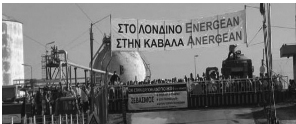
Στιγμιότυπο από την απεργία των εργαζομένων της Energean Oil (Δεκ 2021).

Η ρητορική αυτή δεν φαίνεται να αλλάζει και πολύ στο κομμάτι των μικρότερων επιχειρήσεων. Τα αφεντικά, όπως και εν μέσω πανδημίας, έχουν